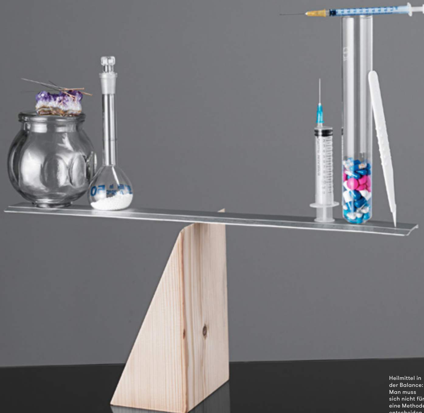
Heilmittel in der Balance: Man muss sich nicht für eine Methode entscheiden

Interview: HELENE AECHERLI